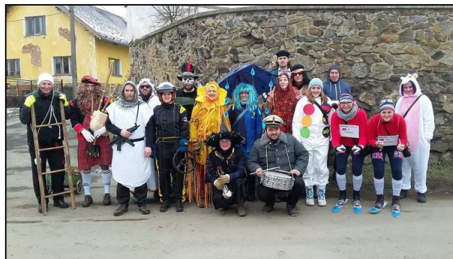
Masopust Stanětice + Hříchovice

Podílejte se na tvorbě věstníku a webu obce i Vy – náměty posílejte na ouzahorany@email.cz