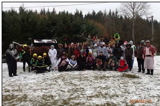
Masopust v Oprechticích

2.6.2018 Oprechtice Oslava 95 let SDH Oprechtice